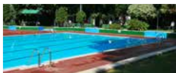
Piscina de verano O'Donnell