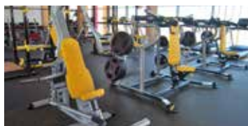
Sala fitness y musculación