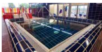
Área de spa, sauna y baño turco