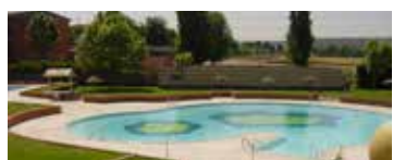
Piscina de verano Juncal