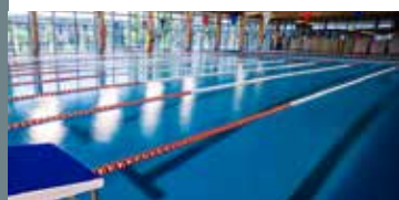
Piscinas deportiva y de enseñanza