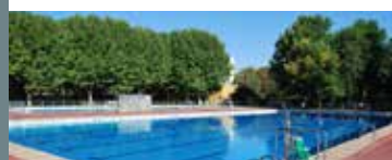
Piscina de verano Val