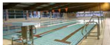
Piscina cubierta Juncal

En piscinas cubiertas, consultar horarios de uso libre en el folleto informativo correspondiente o en la web: www.oacdmalcala.org