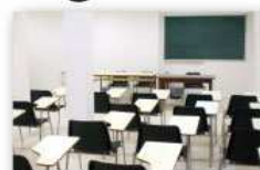
Aula de Formación