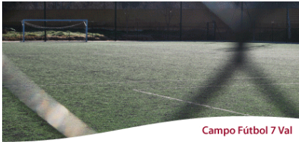
Campo Fútbol 7 Val