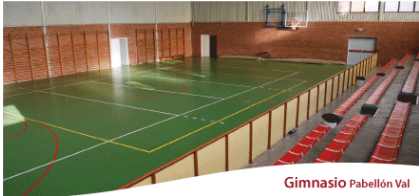
Gimnasio Pabellón Val