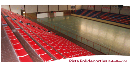
Pista Polideportiva Pabellón Val