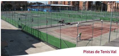
Pistas de Tenis Val