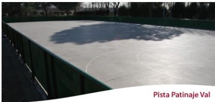
Pista Patinaje Val