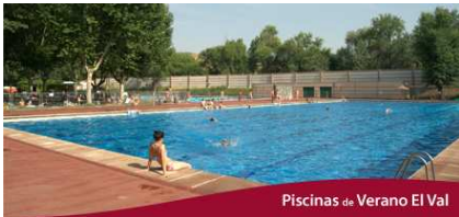
Piscinas de Verano El Val